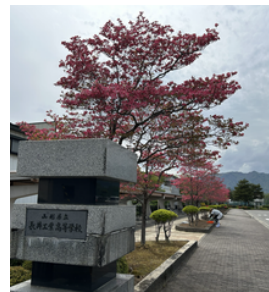
校門とハナミズキ