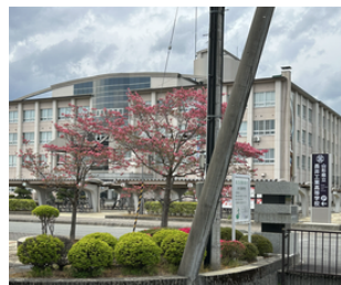
校舎とハナミズキ