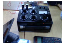
電子科2年生「電気回路」の一幕